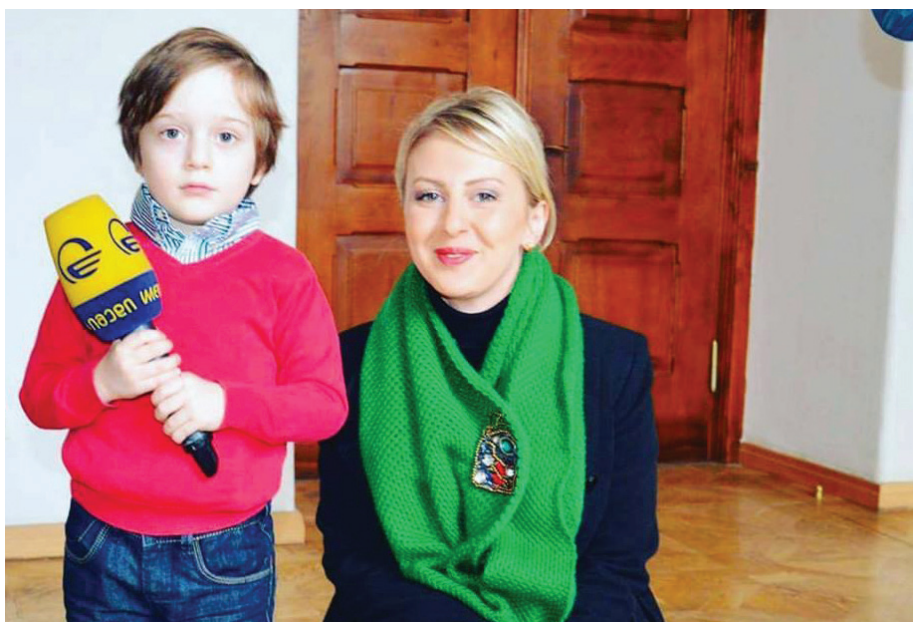
Լրատվամիջոցները պետք է պաշտպանեն մանուկների շահերը:

Լրատվամիջոցները, մանկական հարցերի լուսաբանմանը, իհարկե, առանձնահատուկ ուշադրությամբ և զգուշությամբ պետք է մոտենան: Երեխայի շահերը առանձնակի ձևով պաշտպանված արտոնությունից են օգտվում, ինչը սահմանում է լրագրողների մասնագիտական և էթիկական չափորոշիչները: Լրատվամիջոցների համար կան մի շարք ազգային և միջազգային հանձնարարականներ, որոնք նրանց