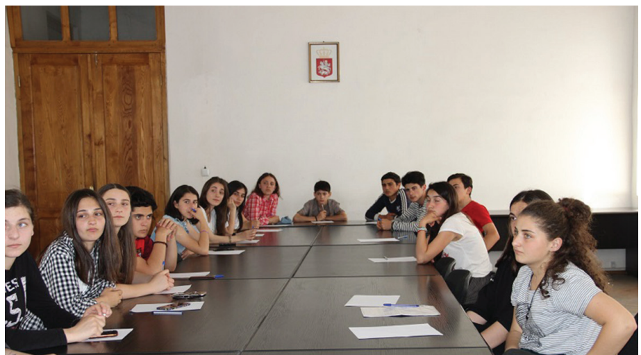
Աշակերտները մասնակցում են ինքնակառավարման իրականացմանը: