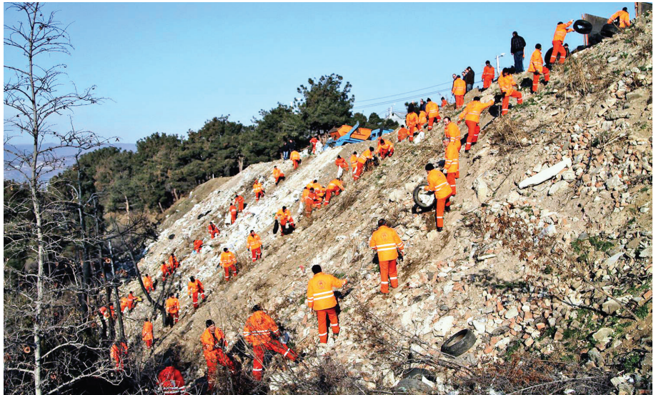
Թբիլիսիի շրջակայքի մաքրումը կենցաղային թափոններից

https://www.coe.int/en/web/good-governance/imc/ )