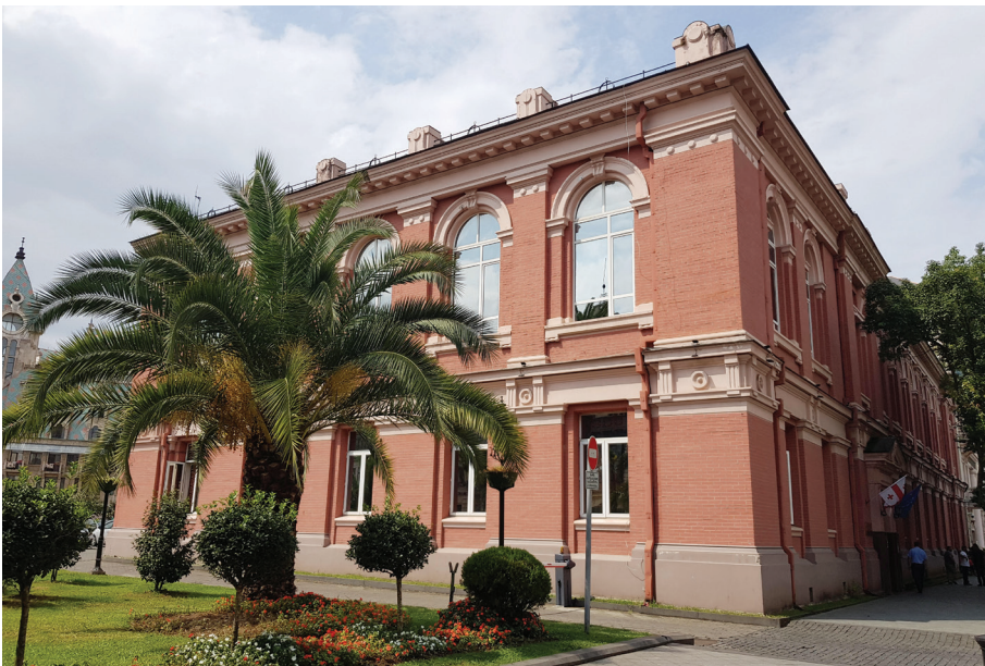
Սահմանադրական դատարան, Բաթումի