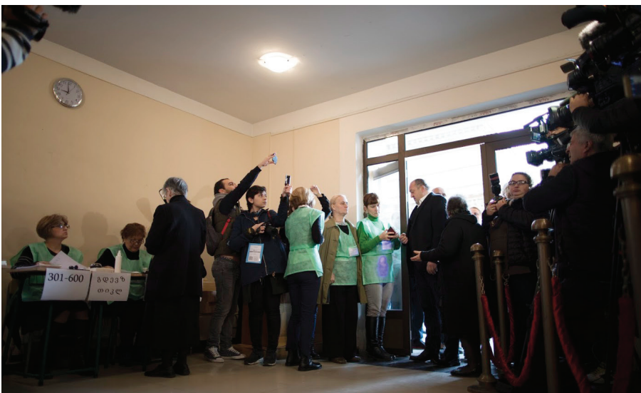
Լրատվամիջոցները և ընտրությունները

( https://www.youtube.com/watch?v=b2OcKQ_mbiQ - այս հղումով առաջ գնալով, կարող եք տեսնել «Հարվածի՛ր նրան» (Slap Her) տեսահոլովակը՝ կանանց նկատմամբ բռնության դեմ, որը պատկանում է իտալական fanpage.it-ին: Տեսահոլովակը պատմում է, թե ինչպես են վարվում որոշ տղաներ, երբ նրանց խնդրում են հարվածել աղջկա:)