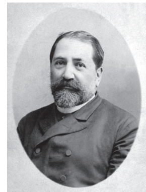
ԻԼՅԱ ՃԱՎՃԱՎԱԶԵ (1837-1907) - վրաց գրող, բանաստեղծ, հրապարակախոս, քննադատ և լուսավորիչ: Իյա Ճավճավաձեի XIX դարի վրաց գրականության և հասարակական կյանքի կենտրոնական դեմքերից մեկն է:

Շոտլանդացի լեռնեցին շրջապատված է ինքնամփոփ, աղքատ, ոչ արգավանդ բնությամբ: Նա ժրաջան և վաստակած աշխատանքի արդյունքում է բնությունից ստանում այն մի պատառ հացը, որ տալիս է իր ընտանիքին՝ ապրուստի համար: Նա անձնուրացաբար, իրեն չխնայելով օր ու գիշեր պայքարում է բնության դեմ, և այս ճանապարհով ձեռք բերած ամեն մի կտոր հացը նրա ջանքերի ու աշխատասիրության արգասիքն է: Անկախ նրանից, որ այսպես է մթնում և լուսանում նրա օրը, նա ավելի երջանիկ է և բավարարված, քան պարսիկը,