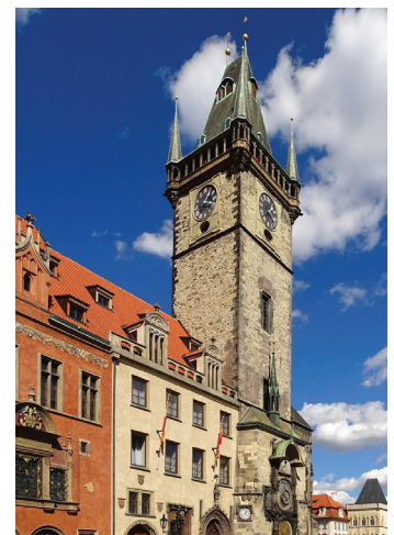
Ռատուշա - Եվրոպայի որոշ երկրներում քաղաքի ինքնակառավարման մարմին, նաև՝ շենք, որտեղ տեղակայված է այս մարմինը:

Այս առումով, Եվրոպական երկրները, ԱՄՆ-ը և մի շարք այլ զարգացած երկրներ բավական զարգացած են: Դրա ապացույցն է « Եվրոպական խարտիա տեղական ինքնակառավարման մասին » փաստաթղթի ստեղծումը, որը ստորագրվել է 1985 թվականին, Ստրասբուրգում: Խարտիան սահմանում է ինքնակառավարման գործունեության երաշխիքները, և այս սկզբունքների ընդունումը պարտադիր է բոլոր երկրների համար: