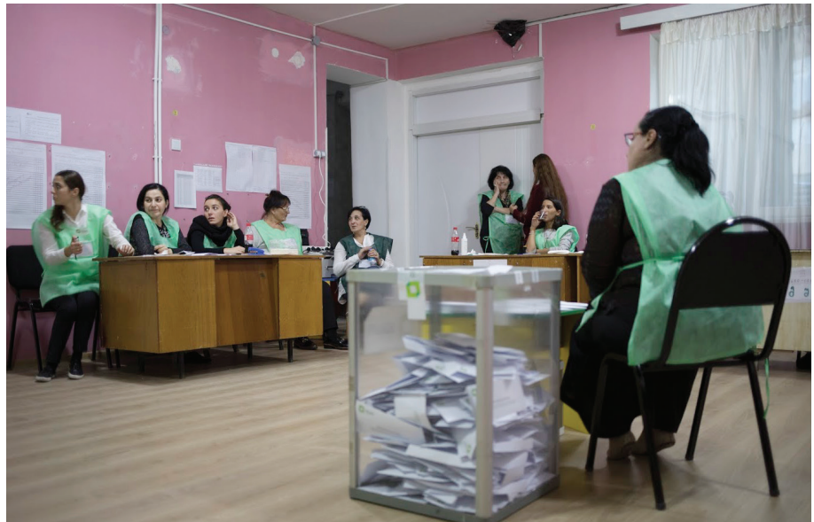
Ինքնակառավարման ընտրությունների օրը