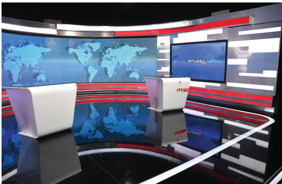
Հանրային հեռարձակող «Մոամբեի» ստուդիան

Վրաստանի մամուլը չունի նման ազգային կանոնագիրը,