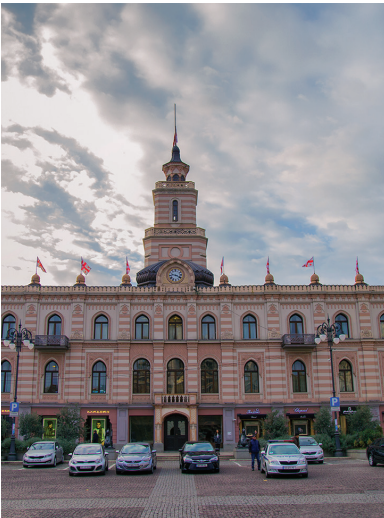
Թբիլիսիի ավագանին Ազատության հրապարակ