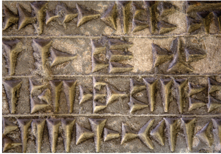
Հին շումերական երկաթագիր

Դասական տեսքով ժողովրդավարության և ինքնակառավարման նմուշ էր ներկայացված հին հունական պոլիսներում : Ժողովրդավարության առումով հատկապես Աթենքն էր առանձնանում, որի մասին պատմությունն ամենից շատ տեղեկություններ է պահպանել: Քաղաքի կառավարմանն անմիջականորեն ընդգրկված էին բոլոր քաղաքացիները, ազատ մարդիկ: Սա ուղիղ ժողովրդավարության ամենավառ օրինակն է: Հենց աթենացիների կողմից ստեղծված ժողովրդավարական կառավարումը դարձավ ժամանակակից քաղաքակիրթ աշխարհի պետությունների կազմակերպման հիմքը: Այս համակարգի ամենանշանակալի տարրն է հանդիսանում ինքնակառավարումը: