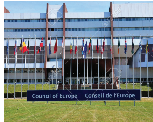
Եվրոպայի խորհրդի շենքը Ստրասբուրգում

Խարտիայի վավերացումից հետո Վրաստանը ստանձնել է Տեղական ինքնակառավարման եվրոպական խարտիայի սկզբունքների կատարման միջազգային պարտավորություն: