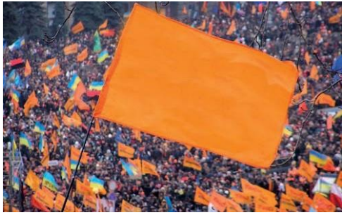
„ნარინჯისფერი რევოლუცია“ უკრაინაში

ჩეხოსლოვაკიის მსგავსად, „ხავერდოვანი რევოლუციების“ ტალღამ გადაუარა აღმოსავლეთ ევროპის სხვა ქვეყნებსაც (პოლონეთი, უნგრეთი). ამგვარივე „უსისხლო“ მეთოდით დასრულდა ზოგიერთი პოსტ საბჭორეჟიმიც (2003 წელი – „ვარდების რევოლუცია“ საქართველოში; 2004 წელი – „ნარინჯისფერი რევოლუცია“ უკრაინაში; 2005 წელი – „ტიტების რევოლუცია“ ყირგიზეთში).