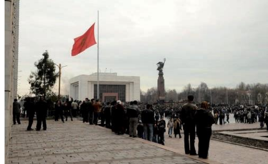
ტიტების რევოლუცია“ ყირგიზეთში