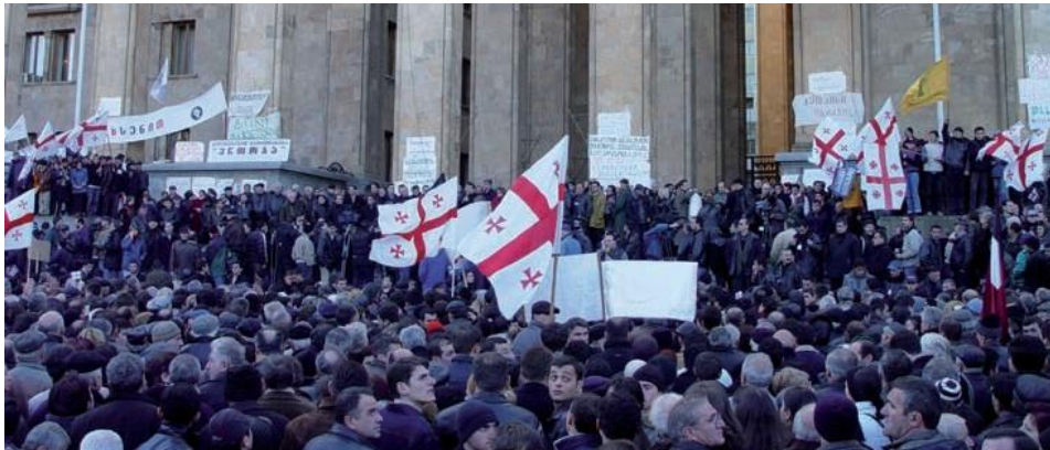
„ვარდების რევოლუცია“ საქართველოში